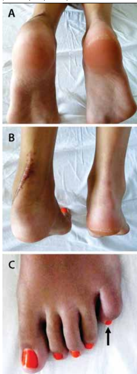
Obrázok 2. Panel A a B: bolestivý opuch ľavej päty, panel B: keloidná jazva po biopsii calcaneu, panel C: bolestivý opuch a začervenanie 5. prsta ľavej nohy – daktylitída

začervenanie a slzenie oka, prípadne aj náhle zhoršenie vísu, chronická uveitída prebieha často nepoznane bez klinických príznakov. Práve prítomnosť subjektívne veľmi intenzívne vnímaných klinických príznakov umožňuje včasnú diagnózu, liečbu a tým aj lepšiu prognózu akútnej uveitídy, i keď z dlhodobého hľadiska má sklon recidivovať. Naopak, pri chronickej uveitíde sa zápalové bunky (leukocyty, lymfocyty, fibrín) dostávajú do prednej komory a usadzujú sa na endotelí rohovky. Depozity bunkového materiálu v prednej komore (hypopyon) a rohovkové precipitáty je možné vizualizovať štrbinovou lampou. Zvýšený obsah fibrínu v komorovom moku vyvoláva vznik zrastov okraja zrenice s prednou plochou šošovky – vytvárajú sa zadné synechie. Výsledkom je nepravidelný tvar a obmedzenie fotoreakcie zrenice. Hromadenie