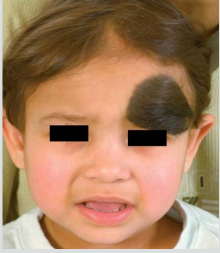
Obrázek 8. Melanocytární névus

Léčba hemangiomů je veskrze konzervativní, pouze sledováním jednou za rok, popřípadě tlakovými masážemi. Rodiče je nutné instruovat o možných komplikacích – ulceraci a krvácení.