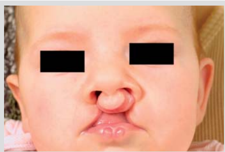
Obrázek 1. Celkový oboustranný rozštěp